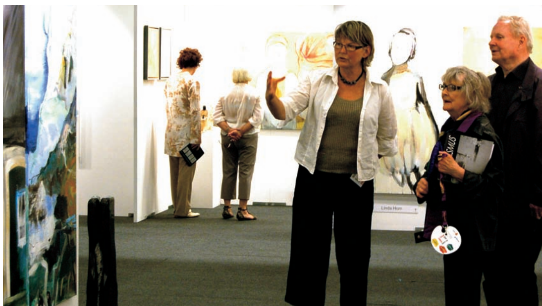
Læg mærke til skiven, kvinden til højre holder i hånden: Det er en Palet Billet, som giver adgang til alle de arrangementer og udstillinger, som indgår i Hillerød Kunst dage.

Kunstpakken bookes på telefon 48 24 08 00 eller hotel@hotelhillerod.dk