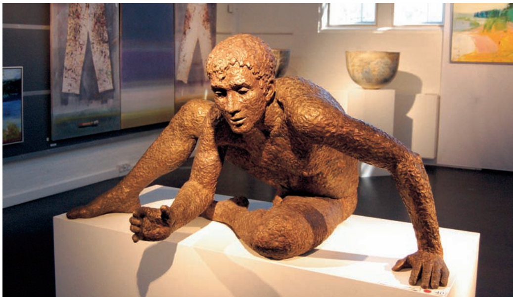
Hillerød Kunst dage på Folkemusset i fjor - igen i år er museet med til at sætte liv i byen.

Læs om aktiviteterne på: www.frederiksborgcentret.dk